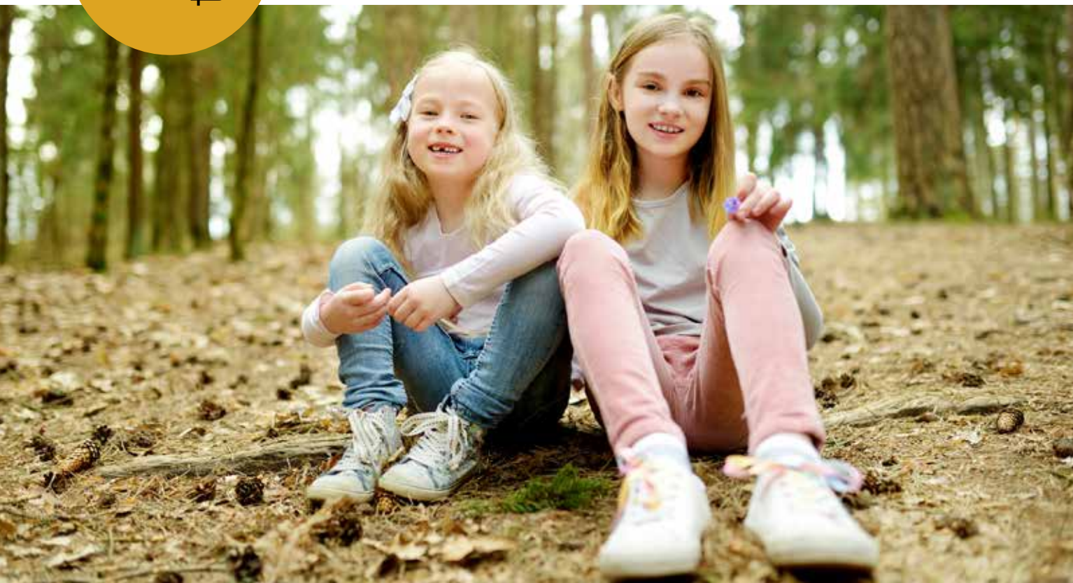
● afin que les enfants placent leur confiance en Dieu.